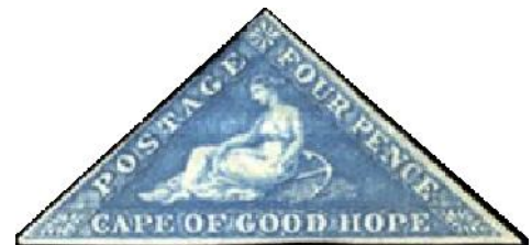
Famoso error de Cabo Buena Esperanza

Estudiaba y ayudaba a su padre, quien le permitía exponer unas hojitas llenas de sellos colocadas detrás de los cristales de la botica. Cierta día se presentaron unos marineros con un saco de los