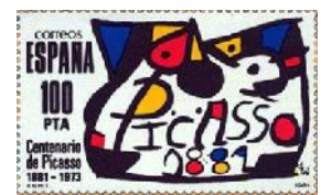
Último sello desmonetizado en España, del año 1981 edifil 2609

El último sello desmonetizado en España es el del 1981 "Homenaje a Pablo Picasso en el centenario de su nacimiento" valor de 100 pts. por haberse detectado falsificaciones del mismo.