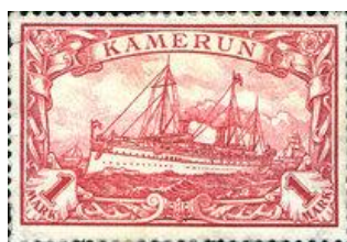
«Hohenzollern», yate del Emperador Guillermo II

La principal herramienta del grabador es el buril. El que nos ocupa se lo armó con una aguja de máquina de coser, que iba sustituyendo por otra cada vez que se le rompía y que tenía montada sobre una pequeña rama de árbol. Las rayas del marco y del fondo denotaban a las claras que el grabador no poseía instrumentos apropiados para obtener filigranas, pero conociendo como ejecutó tal grabado, debemos convenir que el trabajo es cuidado y bien terminado.