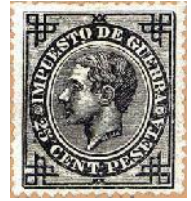
Sello de 25 cts impuesto de guerra

España los emitió cuando su guerra de ultramar; Portugal para sus colonias; el Imperio Inglés recargó su tarifa postal con sellos especiales (War Tac o War Stamp), además del porte corriente.