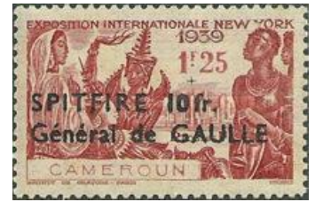
1942 sellos del General De Gaulle

La ocupación más tarde se convirtió en mixta y los sellos lo registraron también, ya que los franceses compartieron su administración. Finalizada la guerra con la paz de Versalles, bajo el mando francés, empezaron a aparecer las series pictóricas, dándose a conocer el país a través de sus sellos a base de magníficas reproducciones. La guerra de