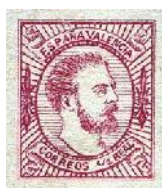
1874 sello de Valencia edifil 159

Durante la guerra de España de 1874 (tercera guerra Carlista) se pusieron en circulación diferentes sellos. El que se destinó a la zona de Valencia fue confeccionado por un guerrillero cuyo oficio era el de grabador, pues al saberse su profesión se le ordenó que compusiera un grabado a fin de que sirviera para imprimir sellos. Alegando que no tenía en su poder las herramientas necesarias para una feliz realización, objetó que si le permitían trasladarse a Valencia buscaría el medio de que le prestaran los instrumentos para poder cumplir el encargo. El permiso le fue denegado conminándole con la orden de que se las arreglará como pudiera e hiciera el trabajo en los intervalos de las marchas.