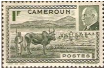
Sello del Mariscal Pétain que no llegó a circular

Francia, que tiene preparadas diferentes emisiones para cada una de sus colonias, entre las cuales hay una con la efigie del Mariscal Pétain, se encuentra ahora que no las puede hacer circular y las expende a París en estado nuevo. Los coleccionistas se afanan en obtenerlas bajo un triple aspecto filatélico-comercial. 1º Para su colección; 2º para