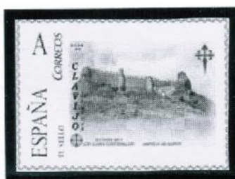
Castillo de Clavijo