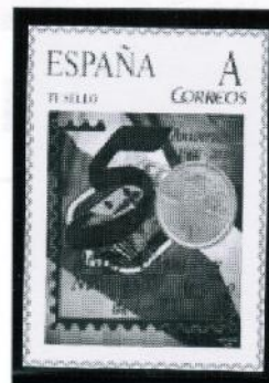
2010/ 50° Aniv. Grupo Filatélico y Numismático Riojano

2010 / Los 6 siguientes “Tus Sellos” están dedicados al Camino de Santiago Riojano