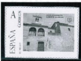
2014 / Iglesia de San Martín. Alberite