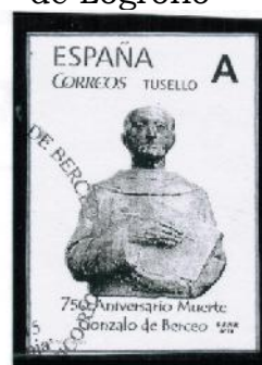
2015 / Gonzalo de Berceo. 750° Aniv. de su muerte