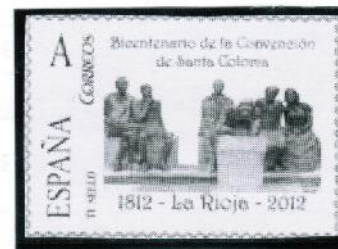
2012/ Bicentenario de la Junta de Santa Coloma