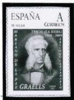
2009/ Bic° Nac. Mariano de la Paz Graells 1809-2009