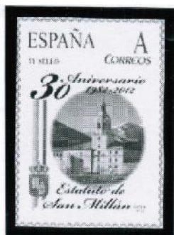
2012/ 30° Aniversario Estatuto de Autonomía