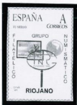
2007/ Emblema Grupo Filatélico y Numismático Riojano

Presentamos a continuación la relación completa de los “Tu Sello” emitidos hasta el momento por el Grupo Filatélico y Numismático Riojano de Logroño , para la celebración de otros tantos eventos, de los cuales algunos ya han sido presentados en anteriores “Porteos”.