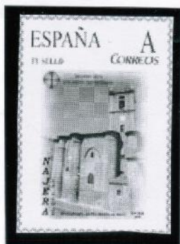
Monasterio de Santa María la Real. Najera