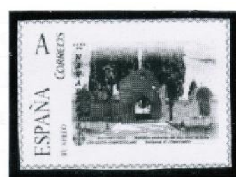
Portada Hospital San Juan de Acre, cementerio Navarrete