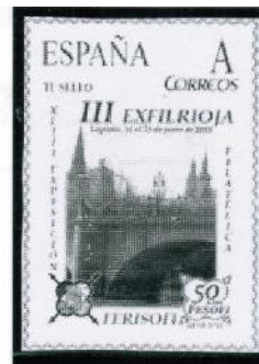
2013/ Puente de Piedra de Logroño