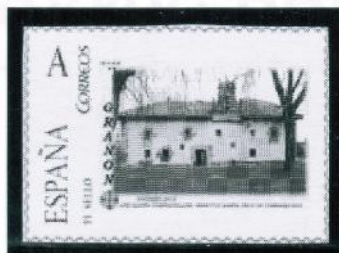
Hospital de Santa Cruz de Carrasquedo. Grañón