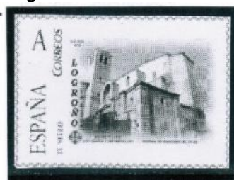
Iglesia de Santiago el Real. Logroño

2010 / Los 6 siguientes “Tus Sellos” están dedicados al Camino de Santiago Riojano