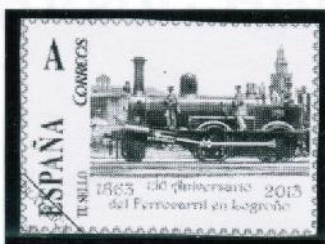
2013/ 150 años de la llegada del ferrocarril a Logroño