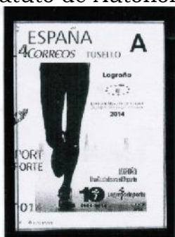
2014/ Logroño: "Ciudad Europea del Deporte"