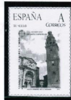
Catedral de Santo Domingo de la Calzada