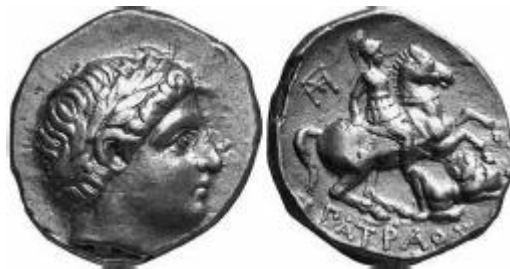
Anverso: Cabeza de Apolo. Reverso: Jinete alanceando a un guerrero caído.

Uno de estos reyes fue el emisor de esta moneda, Patraos o Patros, que reinó entre los años 340 al 315 a C.