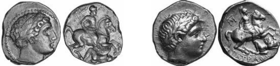
Grafila de puntos.

B) Cabeza de Apolo sin grafila de puntos, siendo los primeros los acuñados primeramente.