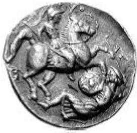
Guerrero tipo macedonio