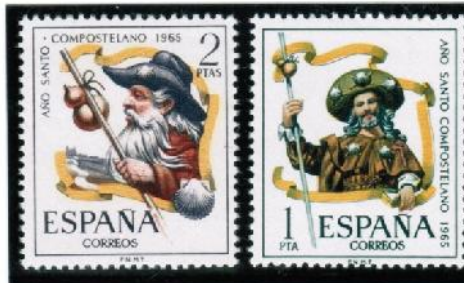
Emitidos el 25.07.1965