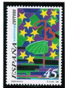
Emitido el 2.10.1993