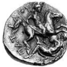
Guerrero tipo celta