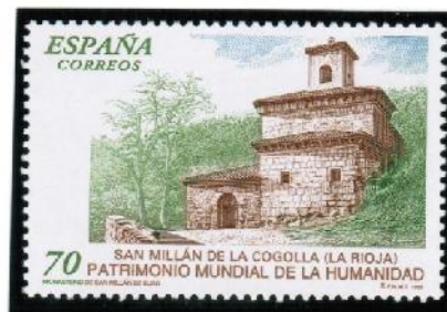
Monasterio de SUSO del s/VI-IX con pórtico mozárabe del s/IX. Emitidos ambos el 8.10.1999