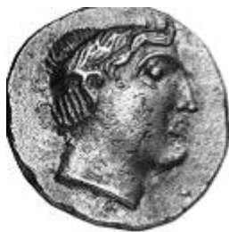
Imitación de los "Diplaios"