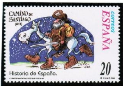
Emitido el 22.09.2000 m.p.

Dos puentes abrazan el río Ebro en su paso por el casco antiguo de Logroño, uno de hierro y otro de piedra. Por este último pasan los peregrinos en su ruta histórica y gloriosa del Camino de Santiago que atravesando la ciudad, continúan camino hacia Navarrete, Nájera, Santo Domingo de la Calzada, San Millán, etc.