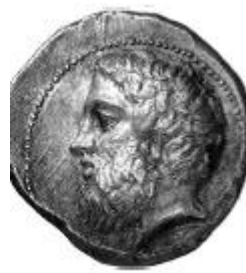
Imitación de los "Teutamados"