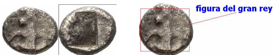
1/24 de siclo acuñado entre los reinados de Artajerjes o Artaxerxes I y Darío II, entre los años 450 al 420 a.C., con un peso de 0,192 gramos y 5 milímetros de diámetro. Moneda inédita y publicada recientemente en los últimos trabajos sobre moneda persa.

Dentro del estudio de las unidades base de la moneda persa, todo o casi todo está escrito, pero es en el apartado de las pequeñas denominaciones donde la numismática actual sigue aportando día a día nuevos conocimientos; y en este apartado es esencial y fundamental la ayuda de los coleccionistas, como el caso de esta pieza, perteneciente a mi colección, pieza inédita, que ha servido para cerrar numismáticamente un periodo de tiempo dentro del imperio persa.