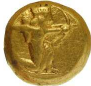
darico y siclo acuñados por Darío

Entre los años 515 al 510 a.C., Darío crea una nueva moneda en oro, el Darico, y una en plata, el Siclo (su nombre proviene de la unidad de peso semítico "shekel"). Tienen tipos idénticos, y así quedarán durante todo el imperio aqueménida.