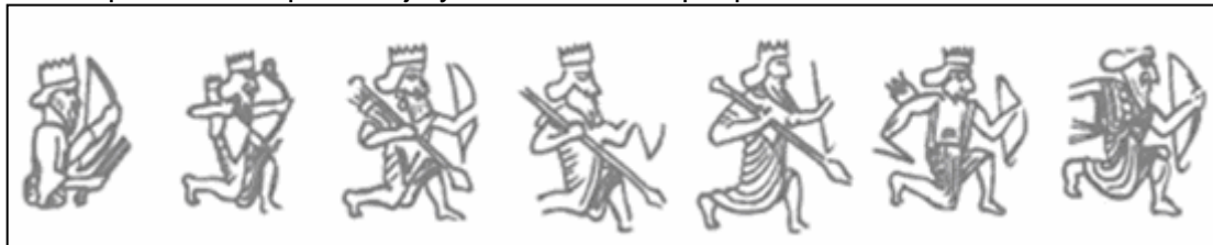
diferentes posiciones del gran rey y armamento que aparecen en los siclos

En el anverso un personaje masculino, vuelto a la derecha; barbudo, vestido como los persas de los relieves de Persepolis, con amplio vestido recubriéndole totalmente, portando una tiara (corona) con picos y llevando armamento variado (lanza, arco y akinakes (puñal corto persa)). Es el gran rey, se trata ante todo de un rey idealizado; no un retrato, como pensaron diferentes numismáticos del siglo XIX. Esta iconografía perdurará hasta el final del imperio; las únicas variantes son la posición del personaje y el armamento que porta.