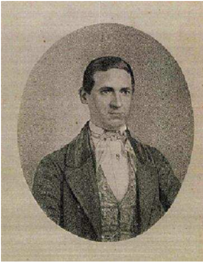
Cosme García a la edad de 30 años

Cosme García Sáez, nació en Logroño en 1818 y falleció en 1874 en Madrid. De gran talento natural, desde muy temprano mostró una gran habilidad en todos sus oficios; fue aprendiz de relojero, guitarrero (construía guitarras y bandurrias) y tocaba varios instrumentos, trabajó en el torno al aire, grabador en metales... Sin ninguna duda podemos decir que era un manitas, destacando en todas las profesiones en las que trabajó, por su ingenio y destreza, siempre mejorando los procesos del oficio. Fue el primer español en inventar un sumergible.