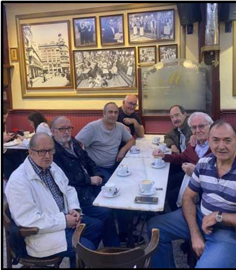
Café Moderno tertulia del coleccionismo

Continuamos con nuestras reuniones los domingos por la mañana. Un pequeño grupo de socios y coleccionistas nos reunimos en el “Café Moderno” de Logroño para charlar sobre los diferentes coleccionismos que mantenemos y luego visitar el mercadillo del coleccionismo que tiene lugar los domingos en la Plaza del Mercado de Logroño.