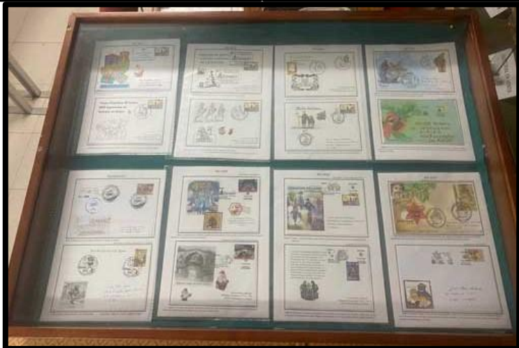
Últimos matasellos emitidos de Navidad