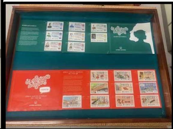
Colección décimos lotería - Javier Blanco