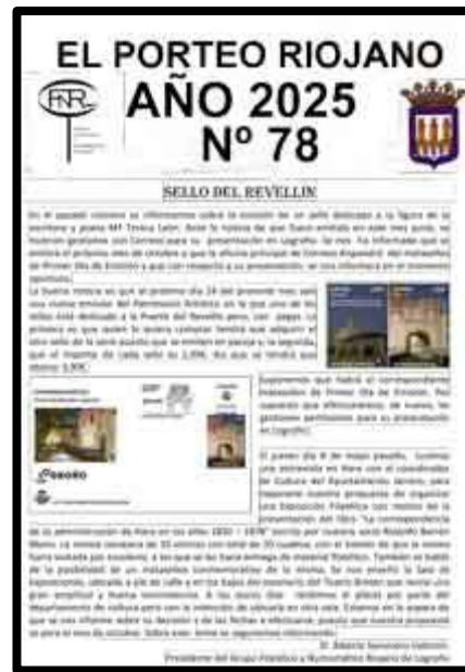
Nº 78 Agosto mandado desde Cantabria, turístico