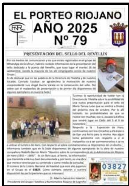
Nº 79 octubre mandado desde Lardero CIR5