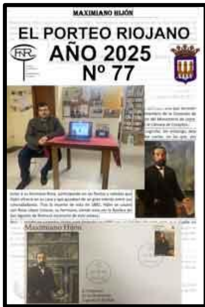
Nº 77 mayo mandado desde Lardero CIR1

Son veinte años los que llevamos publicando nuestro Boletín con el fin de mantener informados a todos nuestros socios de todo lo que acontece en nuestro Grupo así como artículos sobre temas filatélicos y numismáticos