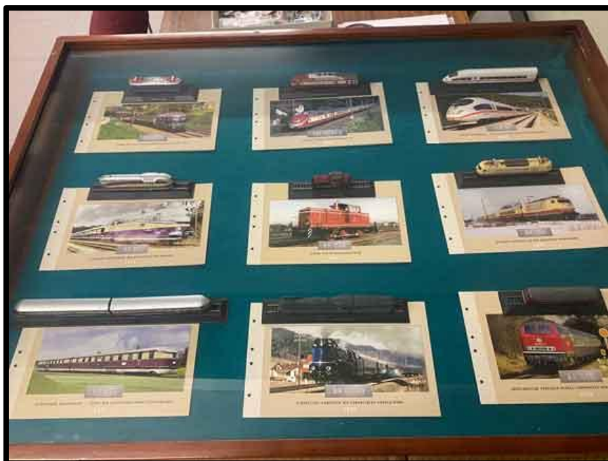
Maquetas de ferrocarriles