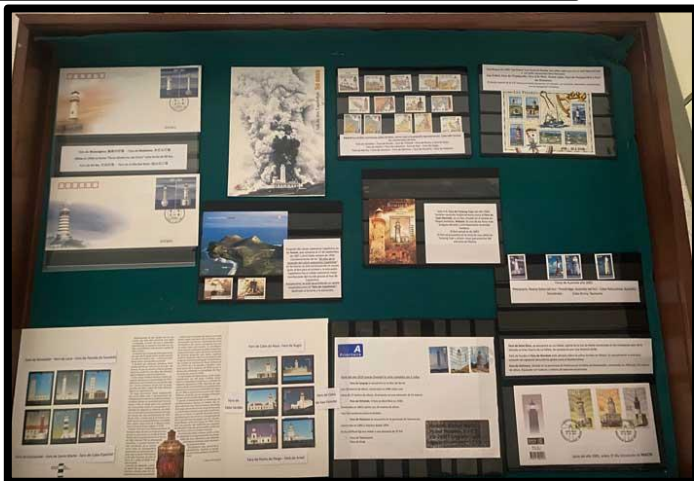
Colección de sellos de faros