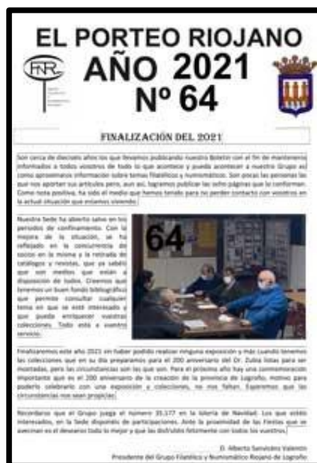
Nº 64 diciembre

Llevamos ya más de 60 números que se pueden leer en nuestra web: