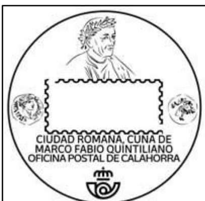
Oficina postal de Calahorra, imagen de Marco Fabio Quintiliano