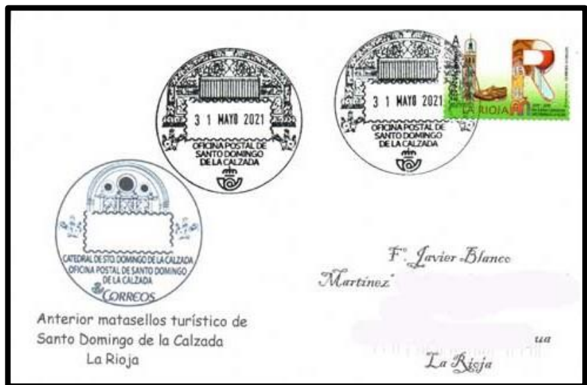
Anterior matasellos turístico de Santo Domingo de la Calzada La Rioja