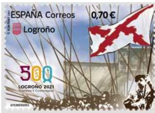
Sello, V Centenario Asedio de Logroño