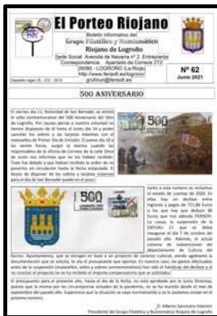
Nº 62 junio