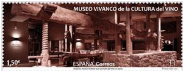
Sello, Museo Vivanco de la cultura del vino

Con los tres sellos riojanos que han salido en este año hemos realizado dos tarjetas máximas y dos sobres