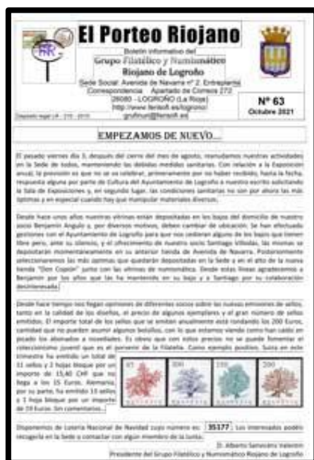
Nº 63 septiembre