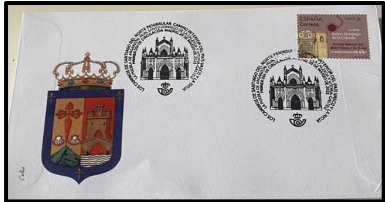
Sobre escudo de La Rioja y matasellos 1º día de Madrid, Camino Interior del País Vasco y La Rioja. Sello Catedral de Santo Domingo de la Calzada (La Rioja).

Con los dos nuevos matasellos turísticos de La Rioja hemos confeccionado dos sobres.