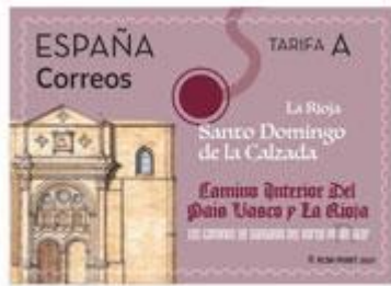
Sello, fachada de la Catedral de Santo Domingo de la Calzada