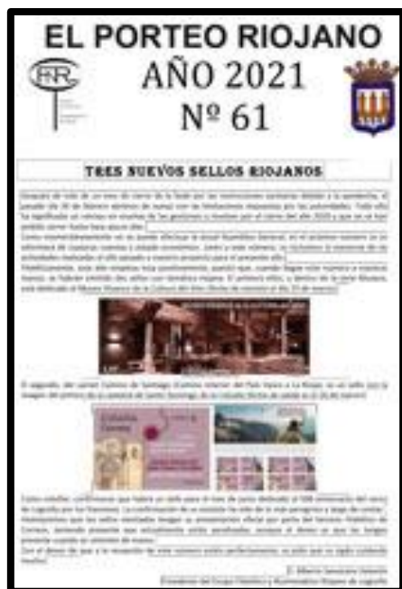
Nº 61 mayo

Son cerca de dieciséis años los que llevamos publicando nuestro Boletín con el fin de manteneros informados a todos vosotros de todo lo que acontece y pueda acontecer a nuestro Grupo, así como, aproximaros información sobre temas filatélicos y numismáticos. Como nota positiva, ha sido el medio que hemos tenido para no perder contacto con vosotros en la actual situación que estamos viviendo