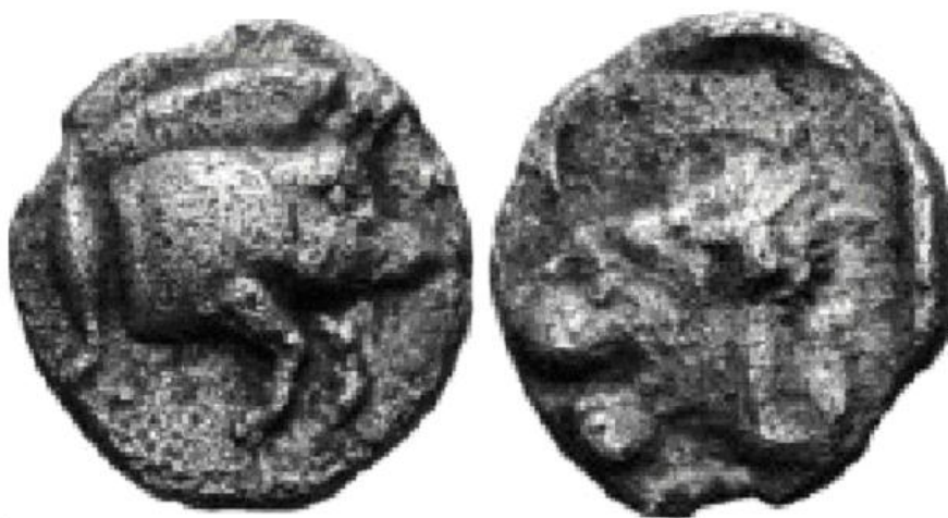
trihemitetartemorion ( 1/6 de dracma o 1/64 de tetradracma) diámetro:7'6/7'8 milímetros peso:0'30 gramos

Las monedas que os presento son un trihemitetartemorion y un tetartemorion. Acuñadas entre los años 530 al 470. La rareza de estas piezas esta en la iconografía del anverso. En las acuñaciones de Kyzikos el jabalí mira hacia la izquierda. En estas primeras labras de la ciudad, el jabalí está hacia la derecha. Al día de hoy desconocemos el porque la ciudad cambia la posición del jabalí.