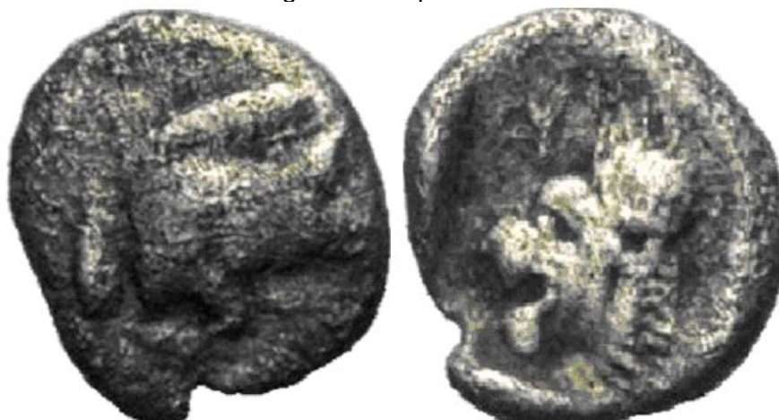
tetartemorion (1/24 de dracma o 1/96 de tetradracma) diámetro: 6 milímetros peso: 0'22 gramos.

anverso: Protome de jabalí a la carrera hacia la derecha, detrás atún hacia arriba reverso: Cabeza de león rugiendo a izquierda dentro de un cuadro incuso.